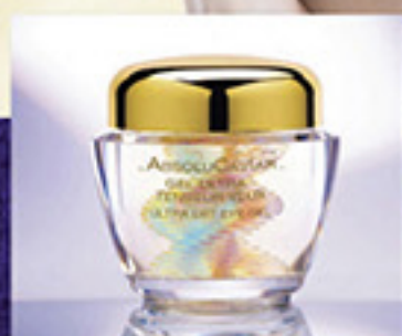
金鑽魚子緊緻雙亮護眼啫喱