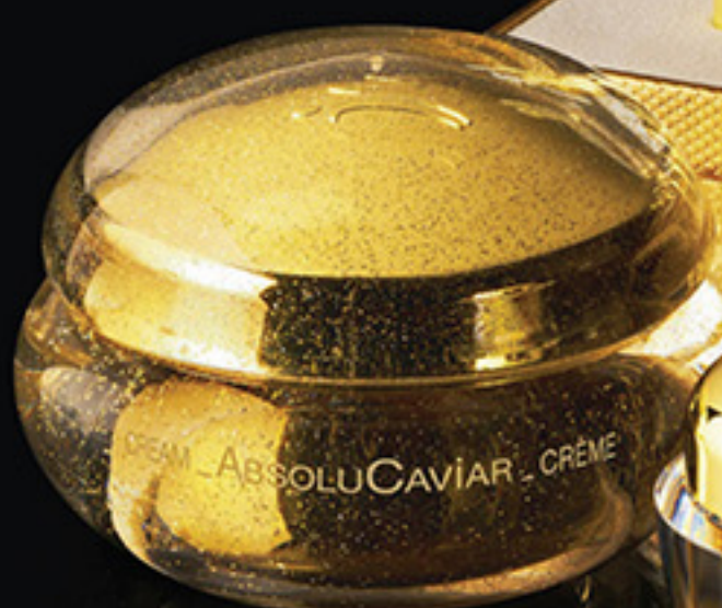
金鑽魚子極緻再生乳霜