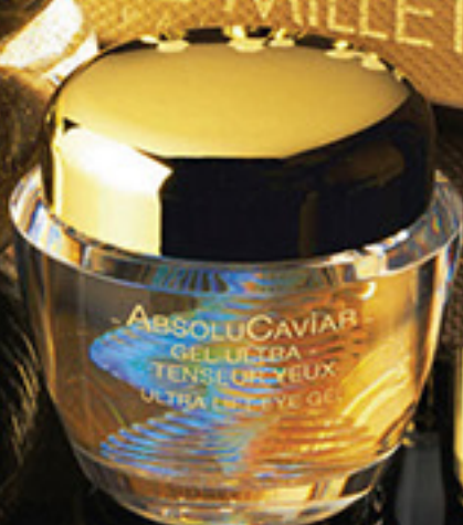
金鑽魚子緊緻雙亮護眼啫喱